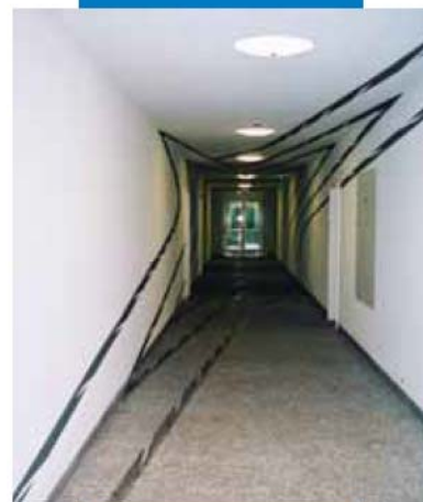
Офис страховой компании - Мюнхен - Германия