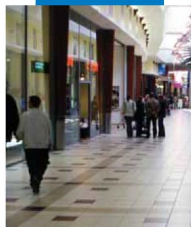
Торговый центр "Кингкросс" - Загреб - Хорватия

Прим.: технические данные клея Kerabond T , затворенного на латексной добавке Isolastic , приведены в технической спецификации Isolastic .