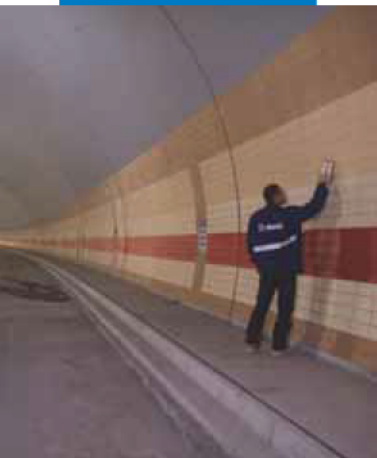
Туннель Мраховка - Прага - Чехия