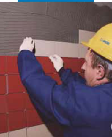
Укладка керамической плитки на стену

Точечное приклеивание тепло- и звукоизолирующих материалов выполняется с помощью терки или шпателя. Число клеевых пятен и их толщина определяются шероховатостью поверхности и весом панели. В этих случаях также необходимо соблюдать рабочее время клея, т.е. максимально допустимое время рабочего