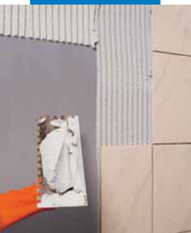
Туннель Мраховка - Прага - Чехия